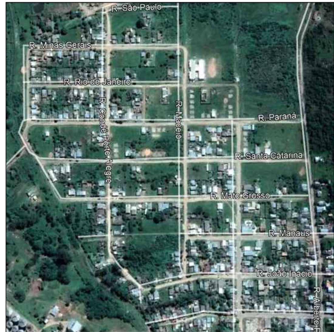
Localização Ruas Bairro Ibicuí S/ Esc.